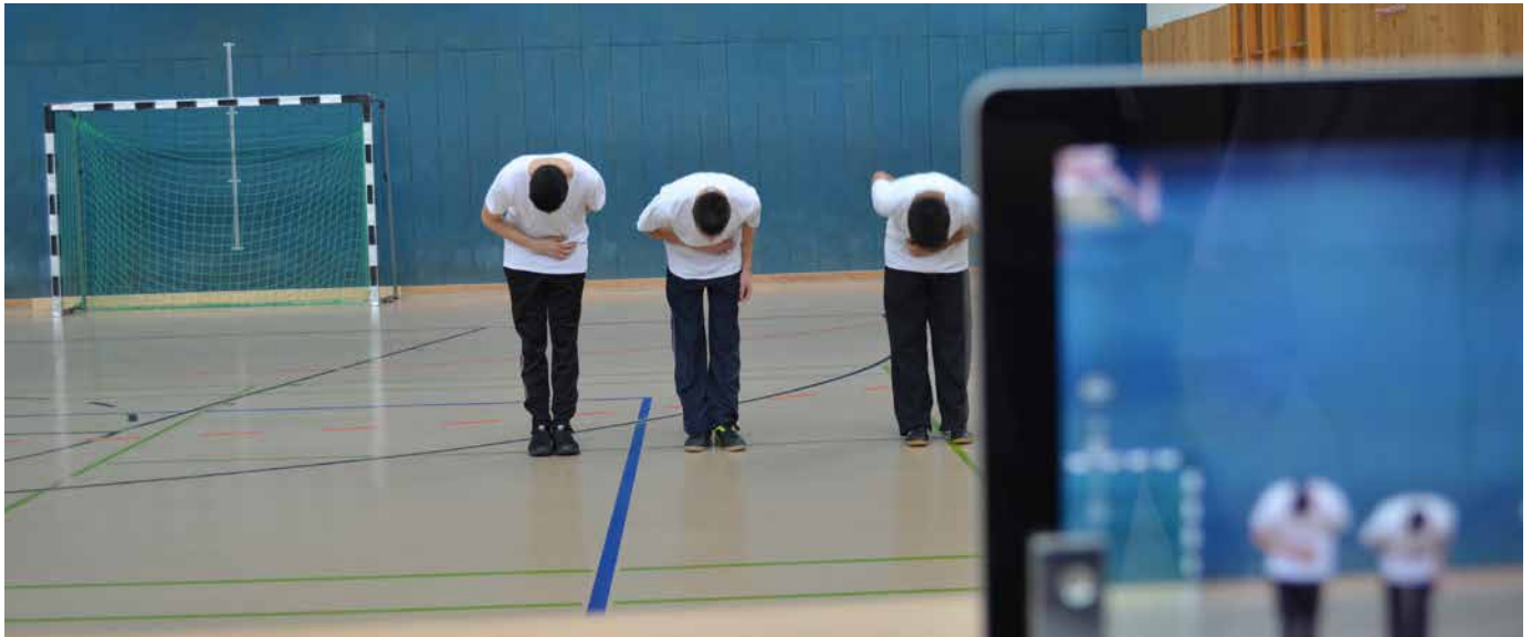
Abb. 6: Prüfungssituation mit dem Tablet