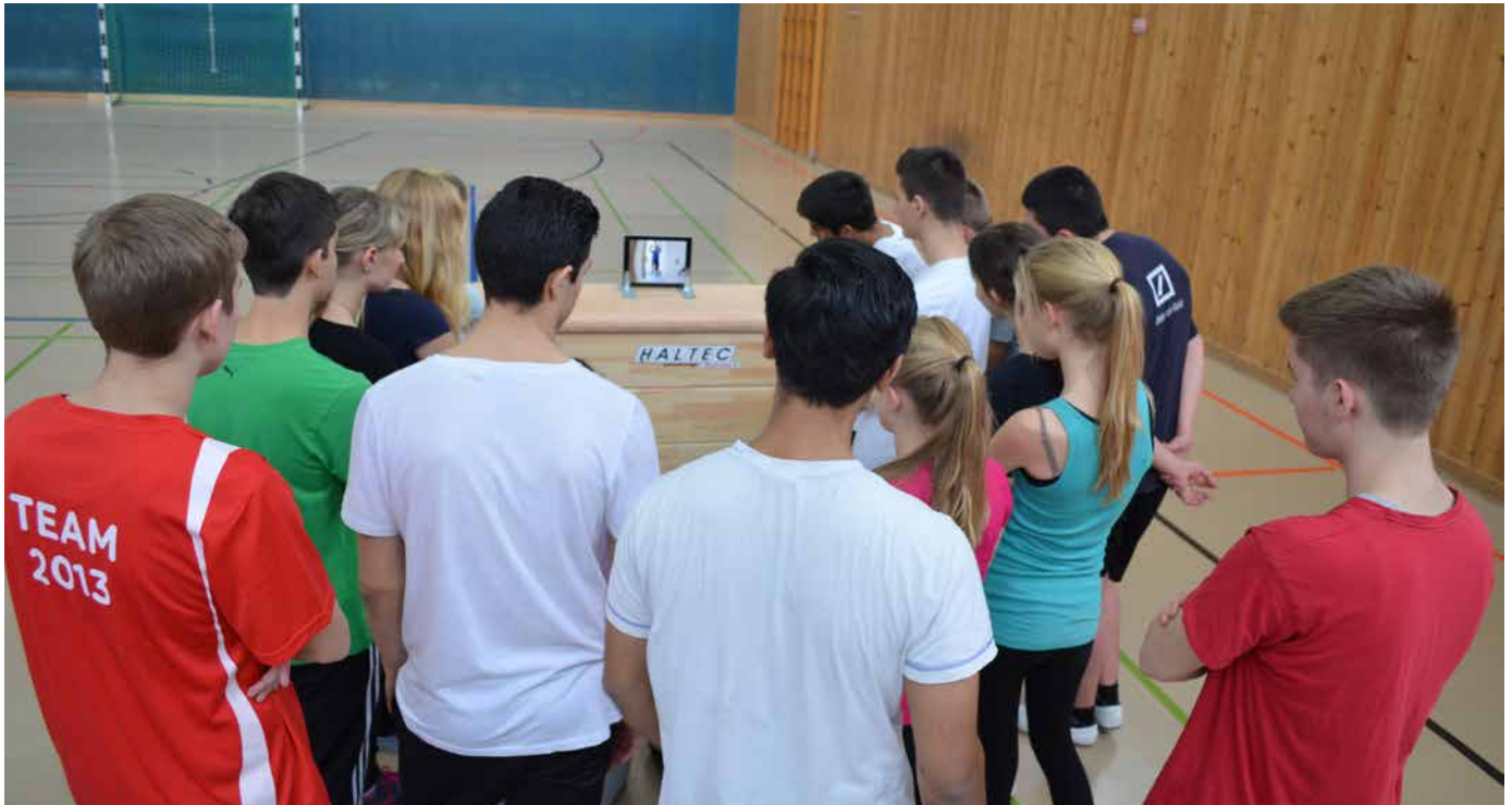
Abb. 1: Einstieg in ein neues Thema mit motivierenden Bewegungsbeispielen

„Digitale Medien – jetzt auch noch im Sportunterricht?“ mögen sich Sportlehrerinnen und Sportlehrer angesichts des einzigen explizit auf Bewegung und körperliche Aktivität ausgelegten Schulfaches fragen und Bedenken und Sorgen bezüglich einer Ablenkung vom eigentlichen Bewegen haben. Hinzu kommen Fragen des Datenschutzes und ggf. Bedenken bezüglich der eigenen Unsicherheit der Lehrperson in technischer Hinsicht. Demgegenüber stehen zum einen aber eine für den Bereich des Sports unausweichliche Präsenz und gesellschaftliche Relevanz digitaler Medien (z. B. bei der Videoanalyse in der Sportschau, bei ausgeprägter Selbstdarstellung auf YouTube mittels Bewegungskönnen etc.) und zum anderen eine zunehmende didaktische Auseinandersetzung mit den Möglichkeiten, aber auch Grenzen der unterrichtlichen Nutzung digitaler Medien.