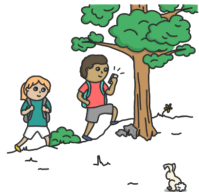
Abb. 5: Educaching

Tablets oder Smartphones eignen sich auch für den Einsatz an außerschulischen Lernorten. Insbesondere die Idee des „Educachings“ stellt ein interessantes Beispiel für mobiles Lernen im Sportunterricht, aber auch in fächerübergreifenden Projekten oder Aktivitäten an Projekttagen oder Klassenreisen dar. Die App Actionbound bietet die technisch sehr einfache Möglichkeit, eine „digitale Schnitzeljagd“ für eine Klasse zu konzipieren. In Kleingruppen machen die Schülerinnen und Schüler wie beim Geocaching die ausgewählte Orte in der bspw. schulnahen Umgebung auffindig und wenn durch GPS vom digitalen Medium