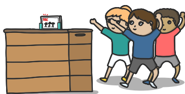
Abb. 4: Leistungsdokumentation

Unterstützung bietet das Tablet oder das Smartphone auch als Dokumentationsmedium zur Leistungsbewertung, bspw. im Rahmen der oben beschriebenen Präsentationen bei Gruppenchoreografien, aber ebenso im Fall einer technischemotorischen Leistung. Während die „klassische“ Präsentationssituation vor der Klasse mit einem hohen Grad an „Körperlicher