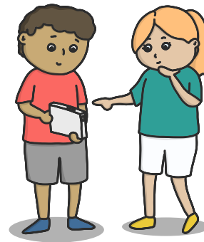
Abb. 2: Bewegungsanalyse

Videodateien auf dem Gerät gespeichert. Neben der Demonstrationsfunktion ermöglicht die Aufnahmefunktion des Tablets auch die Dokumentation von Bewegungsabläufen. Sie verfolgt das Ziel der Bewegungsbeobachtung und -analyse sowie der Förderung der Beurteilungs- und Bewertungskompetenz in Reflexionsphasen (vgl. Müller, 2014).