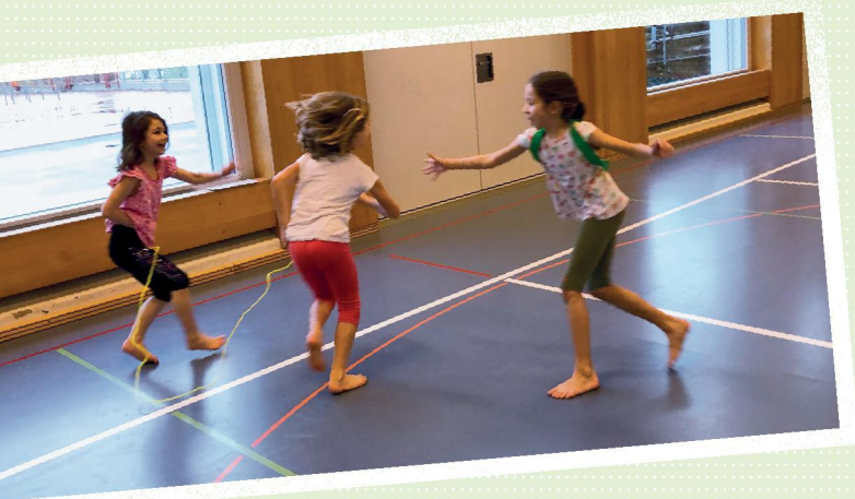
5 Fangspiel in Seilschaften: Wer das Seil verliert, wird Fänger/in