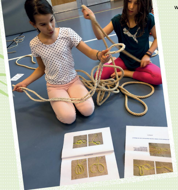
2 Mit der „Knotenschule“ Vertrauen in das Material herstellen