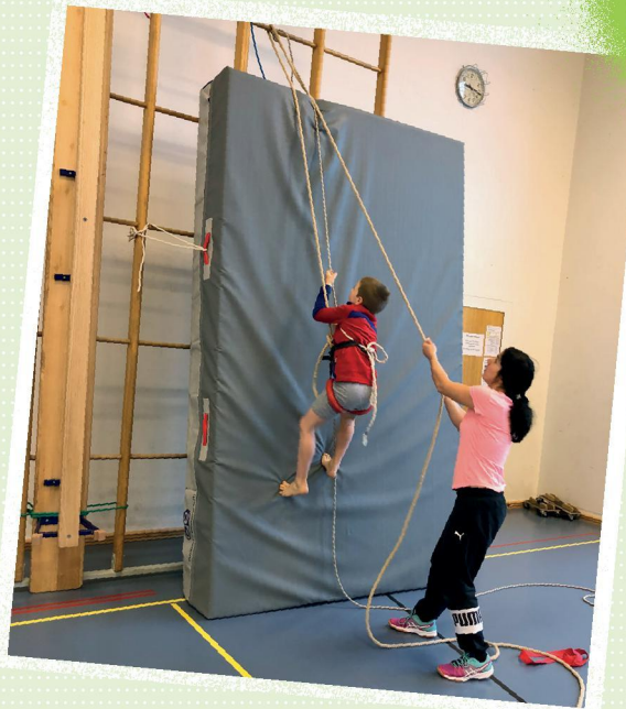
3 Toprope-Klettern mit oben in einer Umlenkung eingehängtem Seil