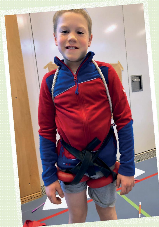
4 Selbstgemachter Klettergurt aus Wurfgummiringen, Spielbändern und Seilen

Das Klettern mit dem Toprope hat einen besonderen Reiz, weil Kinder durch die Sicherung mehr wagen können (s.