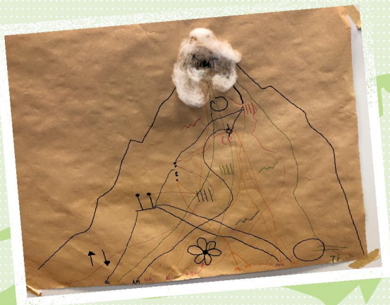
6 Je näher das Symbol einer Station an der Bergspitze ist, desto anspruchsvoller ist sie. Die bunten Linien mit den Kürzeln am unteren Rand sind die Lernwege der Kinder